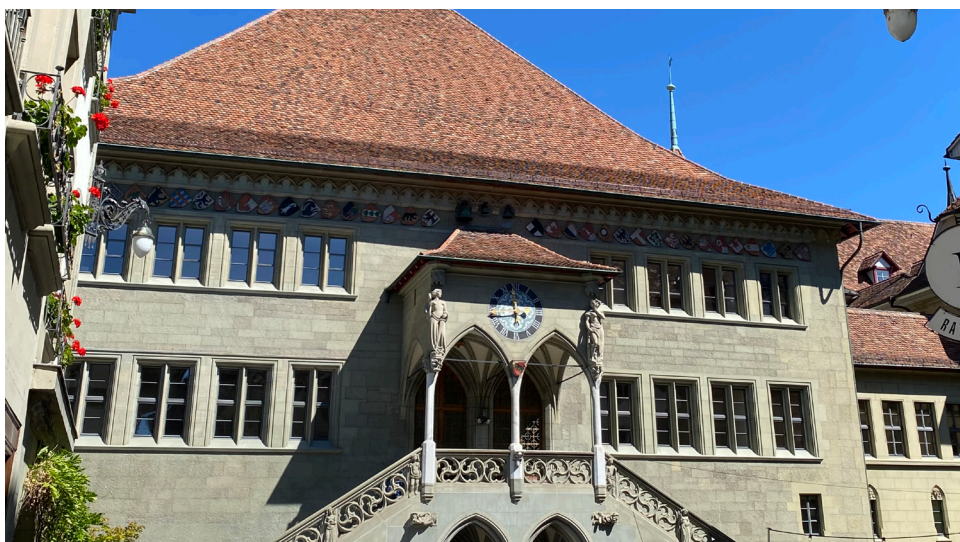
Tatort Rathaus Bern: Am 29. März 2026 entscheidet sich, wer ab Juni hier regiert und neu im Grossen Rat des Kantons Bern sitzt.